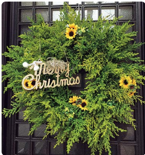
▲クリスマスリース：ベースの緑はゴールドクレストで、ひまわりの小花の造花や飾りをつけて

今月は手作りリースをご紹介します。冬のリースは植物をベースに作ります。リング型オアシスを使ってお庭などの木々の葉をさし込みます。飾りを取り替えればクリスマス、お正月、さらに春までの冬の寒い季節、玄関に彩りを添えてくれます。寒いので植物も日持ちがしますし、簡単にできますので、ぜひトライしてくださいね。