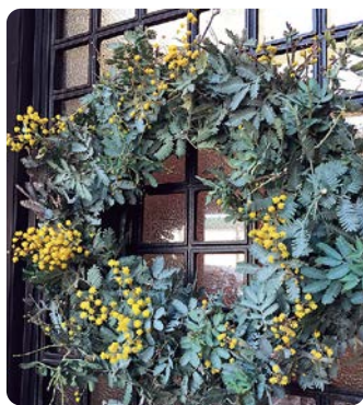
(写真右) ユーカリの葉は大変重宝するので、庭に1本植えておくと便利です (写真左) 3月はミモザが美しい季節

グ型オアシスに ベースとなるゴー ルドクレストや ユーカリなどの緑 を長さ7〜8cmぐ