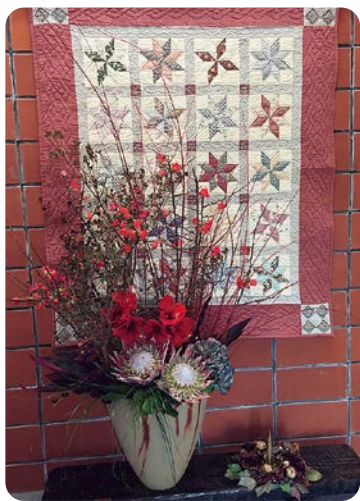
▲12月の玄関はレモンスターのタペストリー。子供が小さい頃、夜なべして作ったクリスマスギルトを飾ります

リースマスらしくなります。大きな花器は、素人には生け込むのが難しいです。初めてお花屋さん、お花の先生にお手本で生けてもらい、写真に収めておきます。次からはそれを参考にして、花材を変えて生けています。